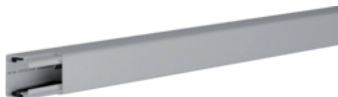
LF, bodemprofiel + deksel 30x30 mm, grijs