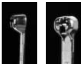
Vue de côté Vue de face