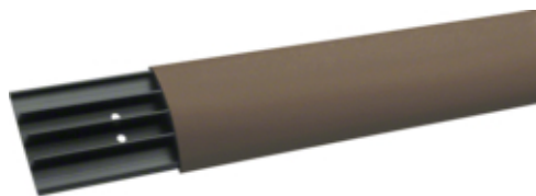
Goulotte 18x75, maron