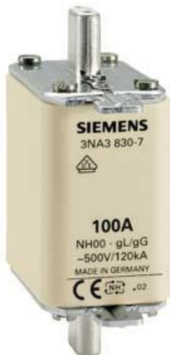
Figure à titre d'exemple

CARTOUCHE FUSIBLE NH GL/GG AVEC LANGUETTES D'ACCROCHAGE NON ISOLEES TAILLE 00, 125A, 500V