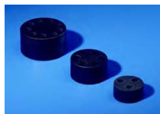
Inserts multi-câbles, Réf., voir page 1055.