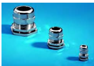
Presse-étoupes, en laiton, Réf., voir page 1054.