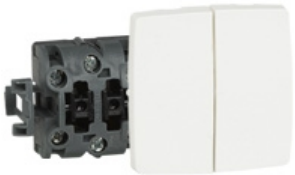
Oteo 2x interrupteur 2 dir