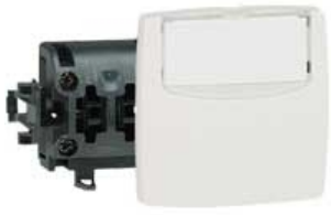
Oteo BP + porte-étiquette