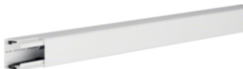
Goulotte 30030, blanc paloma