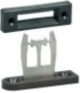
1174113 - AZM 161-B6-2177 AVEC GUIDE D'ENTRÉE