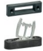
1170375 - AZM 161-B6S