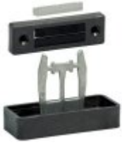
1176642 - AZM 161-B1-2177 AVEC GUIDE D'ENTRÉE