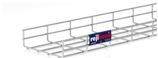
image 60x60 et 60x200 mm