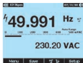
Précision et performances