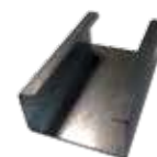
SKG - Kit protection anti-vol (pour conformité à ENV1627 - classe de résistance 2)