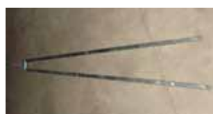
V KIT HEAVY - Adaptateur renforcé pour porte débordante à battants