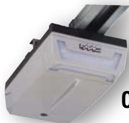
D600 - D1000

Chaque kit est composée d'un opérateur avec rail à chaîne + récepteur/module de fréquence XF868 + 2x mini-émetteurs XT2 868 + 1 clip pour émetteur XT