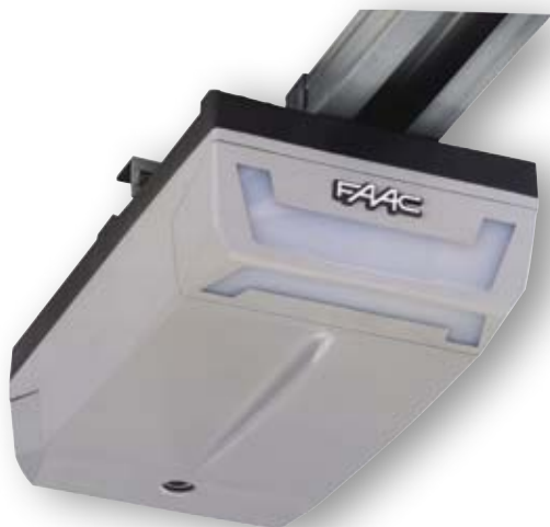
D600 - D1000

à usage domestique (D600 - D700HS) ou collectif (D1000)