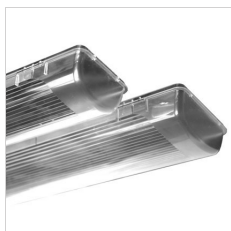
90-04019 Plexi acrylate de remplacement 2x58 W Transparent