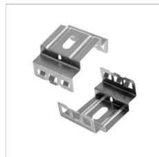
90-04037 Clips imperdables en inox (10)