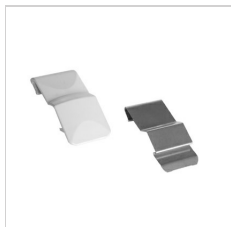
90-04034 Clips de remplacement (10)