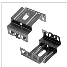
15-00760 Attache plafond en inox, pour montage rapide