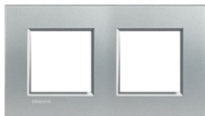
LivingLight - Plaque rectangulaire 2x2 modules 71mm Tech