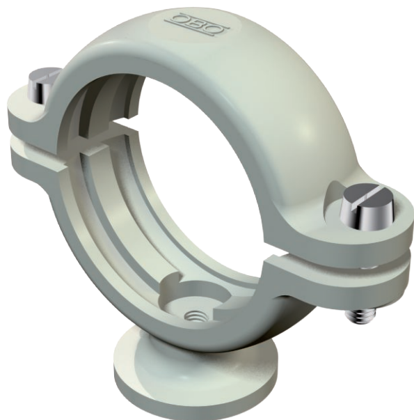
Collier isolant sur socle 25,5-28 mm