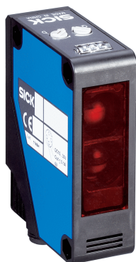
Afbeelding kan afwijken