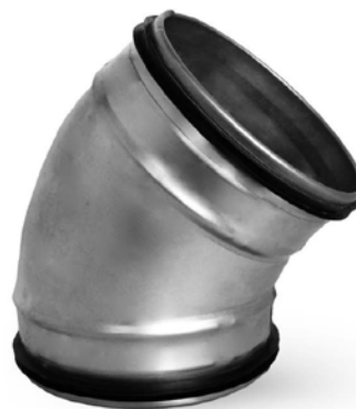
Coude embouti, soudé linéairement et calibré, avec un joint double en caoutchouc EPDM