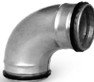
Coude embouti, soudé linéairement et calibré, avec un joint double en caoutchouc EPDM