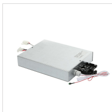
19-02567 PLATO SQUARE KIT EM3P