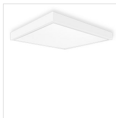
19-02531 PLATO SQUARE CEILING KIT