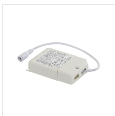
19-02566 PLATO SQUARE DRIVER 36W 1-10V PUSH