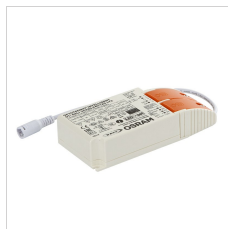
19-02565 PLATO SQUARE DRIVER 36W DALI