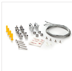
19-02564 PLATO SQUARE kit suspension