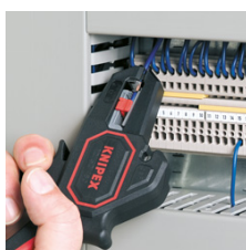
Dénudage dans des espaces exigus