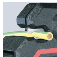
Dénudage précis de 0,2 à 6,0 mm 2