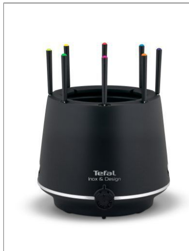
FONDUE THERMORESPECT INOX&DESIGN EF265812

Profitez de tous les types de fondue en toute sécurité grâce à la paroi extérieure isolante !