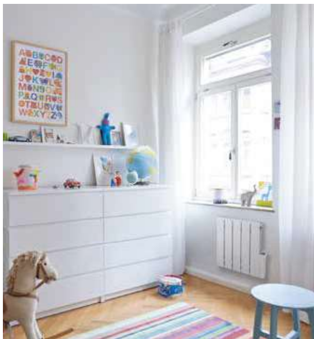
Alura Tech, avec commande LCD