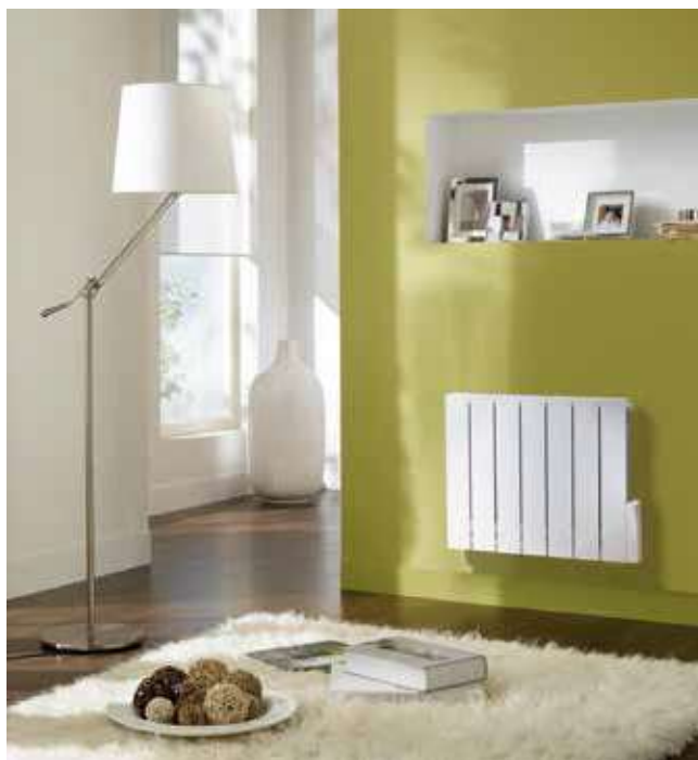
Alura Tech, avec commande LCD