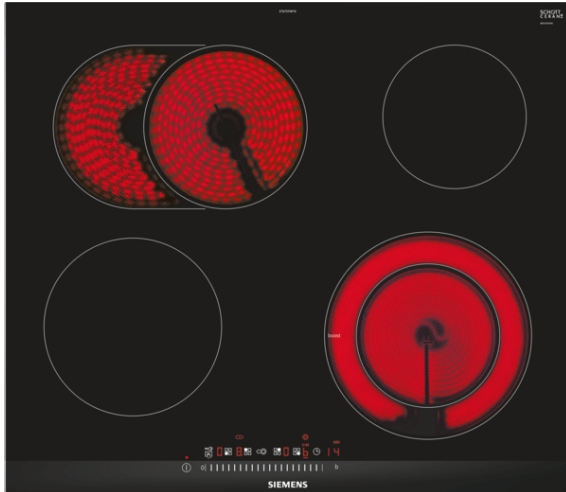
Table de cuisson vitrocéramique - HighSpeed - 60 cm Design à facettes