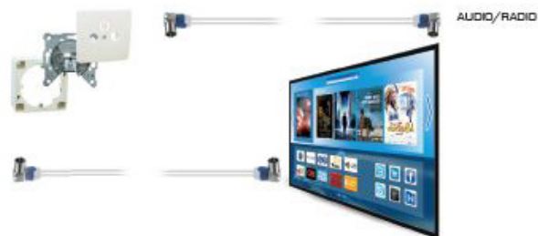
Schéma de connexion