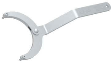
Clé articulée à ergots