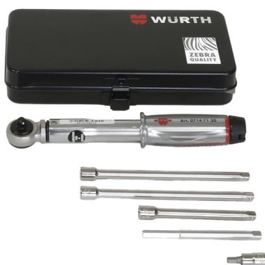
Kit d'assemblage pour HSI 150- DG/HRK SSG