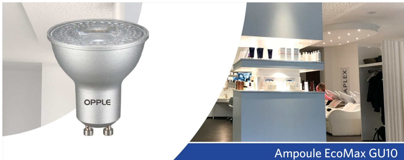
Ampoule EcoMax GU10