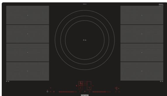
Table de cuisson vitrocéramique à induction - 90 cm Design Pur