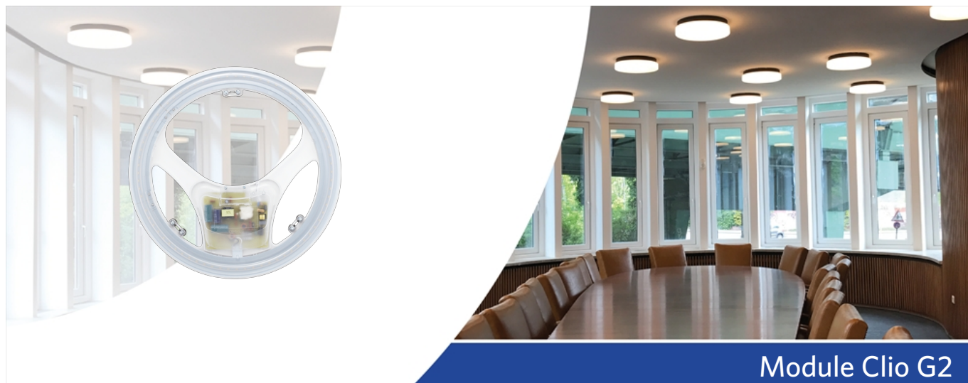
Module Clio G2