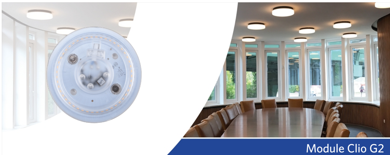
Module Clio G2