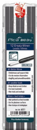
6051 ANILINE 2.0 « mines tout temps » Application « noir profond » sur bois humide.