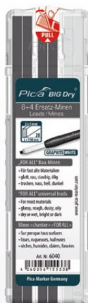
6040 Mines chantier « FOR ALL » graphite + white 8 Mines graphites + 4 mines blanches. Universelles – sur presque tous surface.