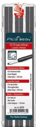
6050 Mines charpentier Sur bois sec.