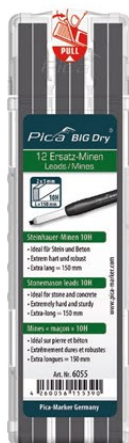
6055 Mines maçon 10H Idéal sur pierre et béton. Extrêmement dures et robustes.