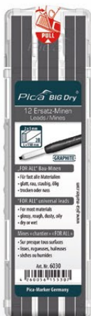
6030 Mines chantier « FOR ALL » graphite Universelles – sur presque tous surfaces.