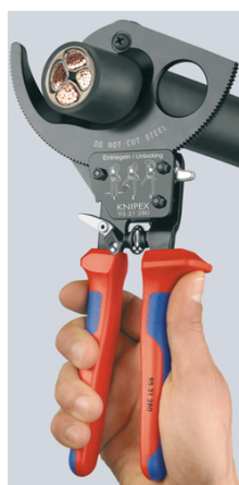
Principe du cliquet et entraînement par couronne dentée à 2 positions pour une coupe moins fatigante