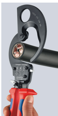
95 31 280: grande capacité de coupe: diam. max. de 52 mm/380 mm 2