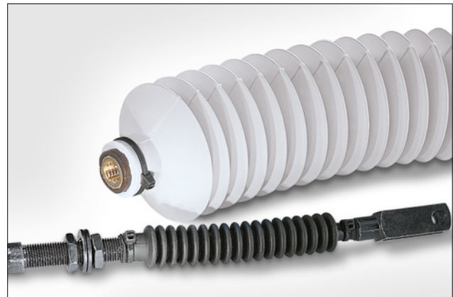
Colliers de la série CTT en application.