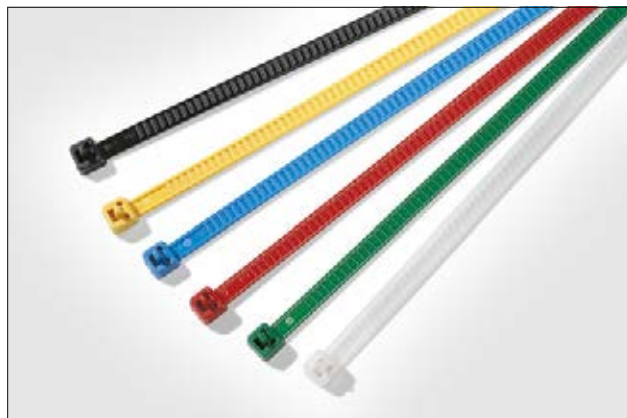
Colliers de couleur et réutilisables, adaptés au repérage et à l'identification des câbles.