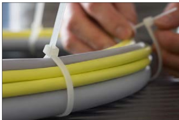
Colliers réouvrables de la série RELK en application.

Flashez moi ! Et visualisez la vidéo de montage RELK