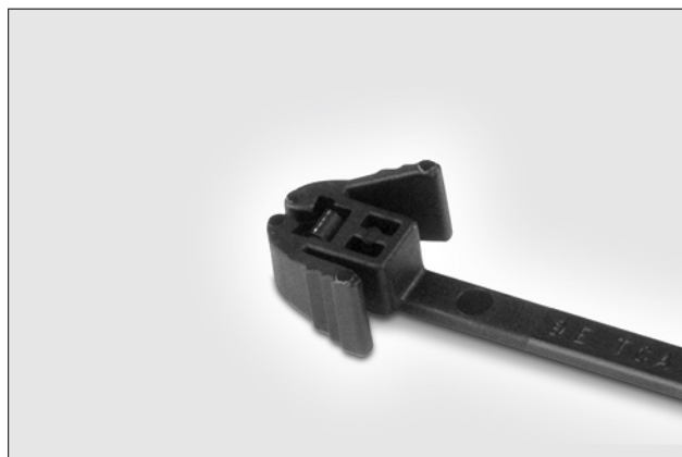
Collier de la série REZ avec système de réouverture par pincement.