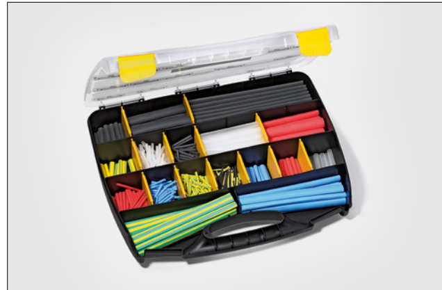
ShrinKit 321 Universal.