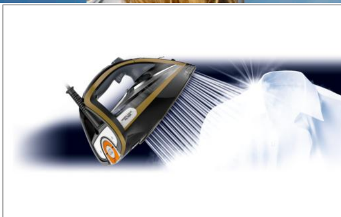
ULTIMATE PURE FV9839C0 FV9839C0