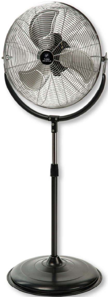
TURBO-455 CN PLUS