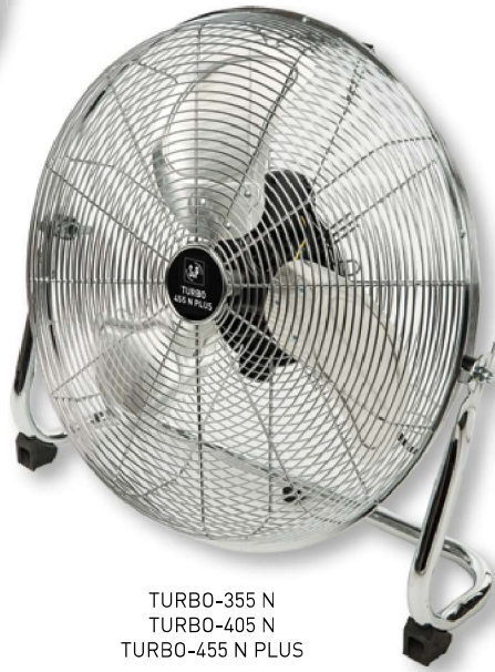
TURBO-355 N TURBO-405 N TURBO-455 N PLUS

Gamme de ventilateurs hélicoïdes portables composée de 3 modèles de sol (360, 400 et 450 mm de diamètre) et un modèle sur colonne 450 mm réglable en hauteur.