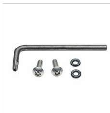
310177 Kit antivandale bruni