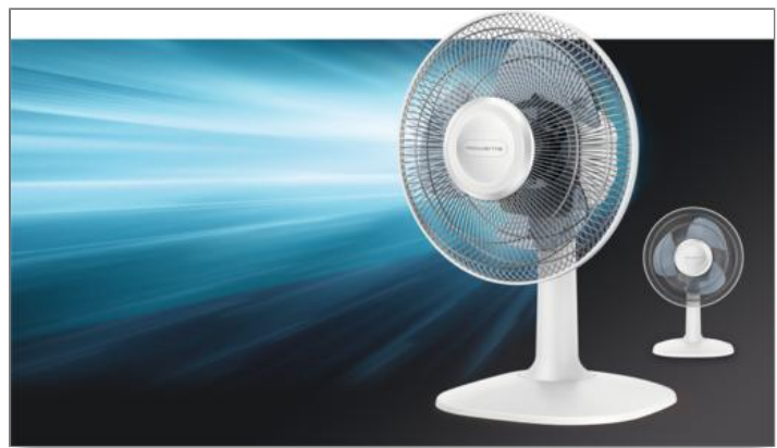
ESSENTIAL+ DESK VU2310F0 VU2310F0