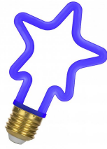
143068 LED Neon Star E27 4W Bleu