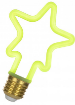
143067 LED Neon Star E27 4W Vert