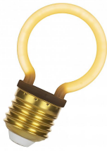
144342 LED Neon G45 E27 2W Blanc