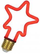
143066 LED Neon Star E27 4W Rouge