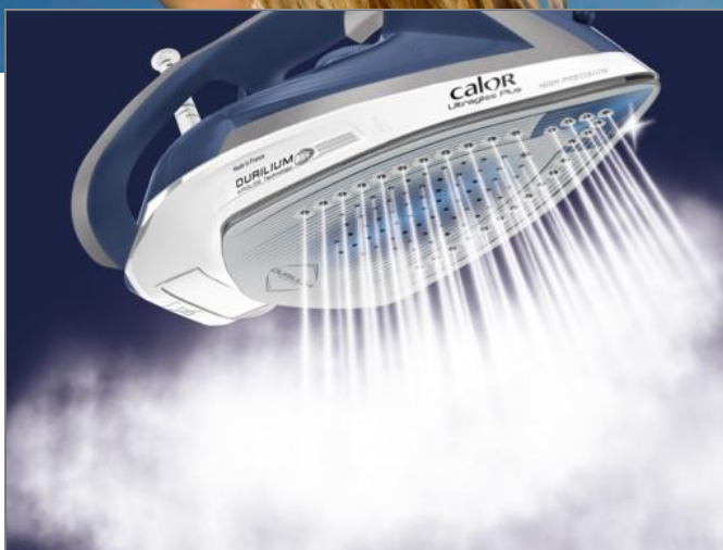
ULTRAGLISS PLUS FV6810+12 FV6812C0