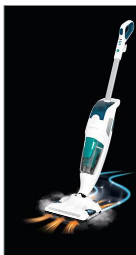
CLEAN & STEAM REVOLUTION clean and steam Revolution RY7777 RY7777WH