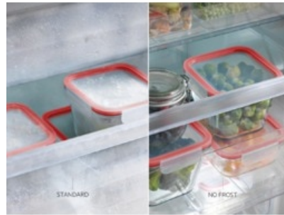
Congélateur, 154 x 60 cm, électronique, NoFrost, blanc