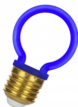
144345 LED Neon G45 E27 2W Bleu