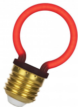
144343 LED Neon G45 E27 2W Rouge