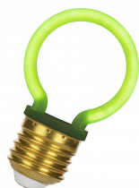
144344 LED Neon G45 E27 2W Vert