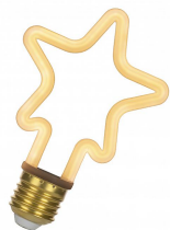
143065 LED Neon Star E27 4W Blanc