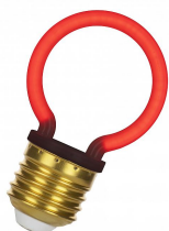
144343 LED Neon G45 E27 2W Rouge