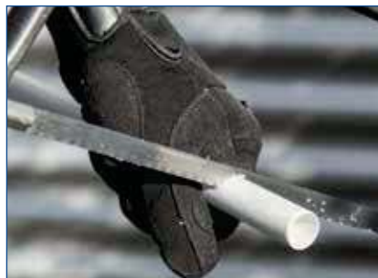
Étape 1: couper