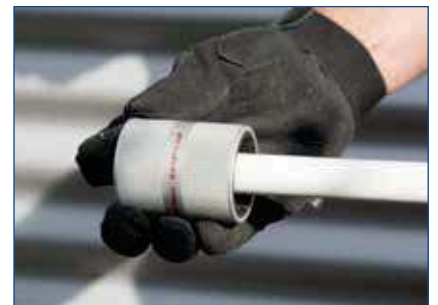
Étape 2: ébavurer/chanfreiner