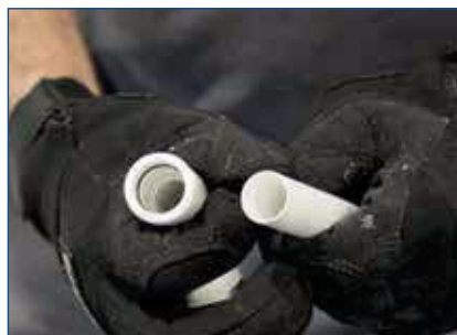
Étape 3: vérifier le joint "O" pré-monté (muni d'un lubrifiant)