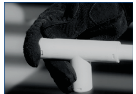
Étape 4: faire la connexion