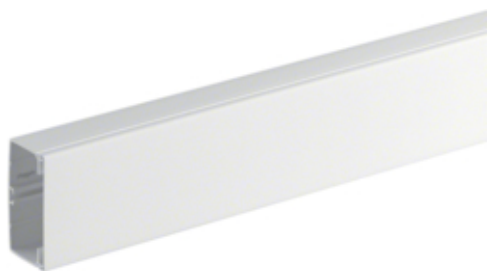
Goulotte FB 60x110mm PVC blanc