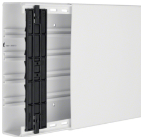
Goulotte FB 60x230mm PVC blanc